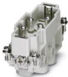
Wkładka styków męskich HEAVYCON serii K4/0, 4-biegunowa, zacisk śrubowy, bez osłony przewodu

Należy pamiętać, że podane dane pochodzą z katalogu online. Proszę o pobranie kompletnych informacji i danych z dokumentacji użytkownika. Obowiązują ogólne warunki użytkowania dla materiałów pobieranych przez Internet. ( http://phoenixcontact.pl/download )