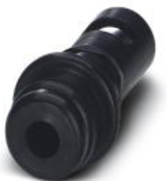
Wtyk pneumatyczny, do modułu HC-M-PN3, wewnętrzna średnica węża 1,6 mm

Należy pamiętać, że podane dane pochodzą z katalogu online. Proszę o pobranie kompletnych informacji i danych z dokumentacji użytkownika. Obowiązują ogólne warunki użytkowania dla materiałów pobieranych przez Internet. ( http://phoenixcontact.pl/download )