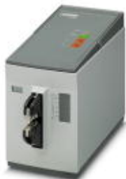
Uniwersalny zaciskacz elektryczny do mocowania matryc różnych elementów stykowych

Należy pamiętać, że podane dane pochodzą z katalogu online. Proszę o pobranie kompletnych informacji i danych z dokumentacji użytkownika. Obowiązują ogólne warunki użytkowania dla materiałów pobieranych przez Internet. ( http://phoenixcontact.pl/download )