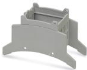
Obud. instalacyjne do zabud., Górna część, szerokość: 35,6 mm, kolor: jasnoszary (7035)

Należy pamiętać, że podane dane pochodzą z katalogu online. Proszę o pobranie kompletnych informacji i danych z dokumentacji użytkownika. Obowiązują ogólne warunki użytkowania dla materiałów pobieranych przez Internet. ( http://phoenixcontact.pl/download )