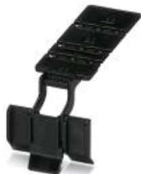
Uniwersalna klamra do przewodów, perforowana, do kanałów oprzewodowania

Należy pamiętać, że podane dane pochodzą z katalogu online. Proszę o pobranie kompletnych informacji i danych z dokumentacji użytkownika. Obowiązują ogólne warunki użytkowania dla materiałów pobieranych przez Internet. ( http://phoenixcontact.pl/download )