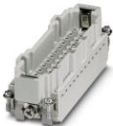
Wkładka styków męskich HEAVYCON, seria B24, 24-pinowa, do styków zaciskanych

Należy pamiętać, że podane dane pochodzą z katalogu online. Proszę o pobranie kompletnych informacji i danych z dokumentacji użytkownika. Obowiązują ogólne warunki użytkowania dla materiałów pobieranych przez Internet. ( http://phoenixcontact.pl/download )