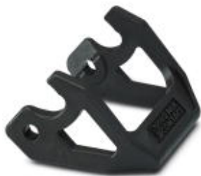
Klamra porzeczna do obudowy B10 / B16 / B24, HC-EVO...AL i HC-STA...AL

Należy pamiętać, że podane dane pochodzą z katalogu online. Proszę o pobranie kompletnych informacji i danych z dokumentacji użytkownika. Obowiązują ogólne warunki użytkowania dla materiałów pobieranych przez Internet. ( http://phoenixcontact.pl/download )