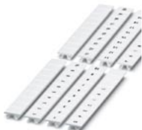
Taśma oznaczników, 10-częściowa, nadruk podłużny z kolejnymi liczbami: 31 ... 40, biały, Szerokość: 8 mm

Należy pamiętać, że podane dane pochodzą z katalogu online. Proszę o pobranie kompletnych informacji i danych z dokumentacji użytkownika. Obowiązują ogólne warunki użytkowania dla materiałów pobieranych przez Internet. ( http://phoenixcontact.pl/download )