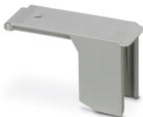
Pokrywa, Długość: 164 mm, Szerokość: 49 mm, Wysokość: 33 mm, Kolor: szary

Należy pamiętać, że podane dane pochodzą z katalogu online. Proszę o pobranie kompletnych informacji i danych z dokumentacji użytkownika. Obowiązują ogólne warunki użytkowania dla materiałów pobieranych przez Internet. ( http://phoenixcontact.pl/download )