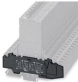
Pokrywa zamykająca, Długość: 115 mm, Szerokość: 6 mm, Kolor: czarny

Należy pamiętać, że podane dane pochodzą z katalogu online. Proszę o pobranie kompletnych informacji i danych z dokumentacji użytkownika. Obowiązują ogólne warunki użytkowania dla materiałów pobieranych przez Internet. ( http://phoenixcontact.pl/download )