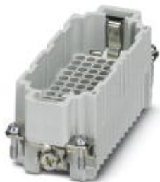
Wkładka styków męskich HEAVYCON, seria DD72, 72-pinowa, złącze zaciskane

Należy pamiętać, że podane dane pochodzą z katalogu online. Proszę o pobranie kompletnych informacji i danych z dokumentacji użytkownika. Obowiązują ogólne warunki użytkowania dla materiałów pobieranych przez Internet. ( http://phoenixcontact.pl/download )