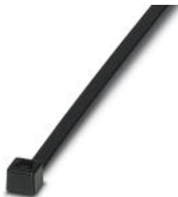
Opaski kablowe, wersja standardowa, do szybkiego i bezpiecznego wiązkania

Należy pamiętać, że podane dane pochodzą z katalogu online. Proszę o pobranie kompletnych informacji i danych z dokumentacji użytkownika. Obowiązują ogólne warunki użytkowania dla materiałów pobieranych przez Internet. ( http://phoenixcontact.pl/download )