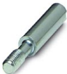
Kolek kodujący do kodowania maks. 16 złączy wtykowych

Należy pamiętać, że podane dane pochodzą z katalogu online. Proszę o pobranie kompletnych informacji i danych z dokumentacji użytkownika. Obowiązują ogólne warunki użytkowania dla materiałów pobieranych przez Internet. ( http://phoenixcontact.pl/download )