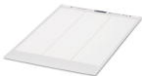
Rys. przedst. wersję artykułu

Arkusz etykiet DIN-A4, Arkusz, srebrny, nieopisane, opisywany przy pomocy: Systemy drukowania Office, Rodzaj montażu: Klejenie, Wielkość pola opisowego: 27 x 18 mm