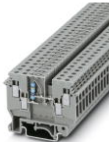
Ilustracja przedstawia wersję UDK 4-DUR 249 z wbudowanym rezystorem

Należy pamiętać, że podane dane pochodzą z katalogu online. Proszę o pobranie kompletnych informacji i danych z dokumentacji użytkownika. Obowiązują ogólne warunki użytkowania dla materiałów pobieranych przez Internet. ( http://phoenixcontact.pl/download )