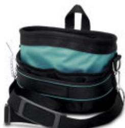
Kieszon narzędziowa, bez wyposażenia

Należy pamiętać, że podane dane pochodzą z katalogu online. Proszę o pobranie kompletnych informacji i danych z dokumentacji użytkownika. Obowiązują ogólne warunki użytkowania dla materiałów pobieranych przez Internet. ( http://phoenixcontact.pl/download )