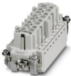
Wkładka styków żeńskich HEAVYCON, seria B16, 16-pinowa, nadruk 17 ... 32, złącze zaciskane

Należy pamiętać, że podane dane pochodzą z katalogu online. Proszę o pobranie kompletnych informacji i danych z dokumentacji użytkownika. Obowiązują ogólne warunki użytkowania dla materiałów pobieranych przez Internet. ( http://phoenixcontact.pl/download )