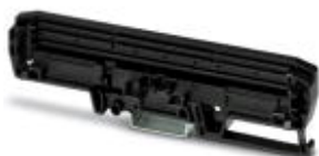
Rysunek przedstawia wersję o szerokości 122 mm

Element boczny (z prawej) ze stopą montażową do szyny nośnej dla profili UM-PRO płytek drukowanych o szerokości 72 mm