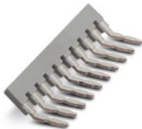
Mostek wtykany, Wymiar rastra: 6,2 mm, Liczba biegunów: 10, Kolor: szary

Należy pamiętać, że podane dane pochodzą z katalogu online. Proszę o pobranie kompletnych informacji i danych z dokumentacji użytkownika. Obowiązują ogólne warunki użytkowania dla materiałów pobieranych przez Internet. ( http://phoenixcontact.pl/download )