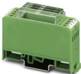
Moduł diodowy, z 4 diodami, łączonymi pojedynczo, typ diody 1N 5408

Należy pamiętać, że podane dane pochodzą z katalogu online. Proszę o pobranie kompletnych informacji i danych z dokumentacji użytkownika. Obowiązują ogólne warunki użytkowania dla materiałów pobieranych przez Internet. ( http://phoenixcontact.pl/download )