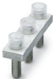
Mostek stały, Wymiar rastra: 20 mm, Liczba biegunów: 3, Kolor: srebrny

Należy pamiętać, że podane dane pochodzą z katalogu online. Proszę o pobranie kompletnych informacji i danych z dokumentacji użytkownika. Obowiązują ogólne warunki użytkowania dla materiałów pobieranych przez Internet. ( http://phoenixcontact.pl/download )