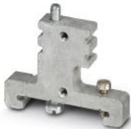
Uchwył końcowy, do montażu na szynie nośnej NS 32 lub NS 35/7,5 aluminium, szerokość: 8 mm

Należy pamiętać, że podane dane pochodzą z katalogu online. Proszę o pobranie kompletnych informacji i danych z dokumentacji użytkownika. Obowiązują ogólne warunki użytkowania dla materiałów pobieranych przez Internet. ( http://phoenixcontact.pl/download )