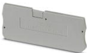
Rys. przedst. wersję artykułu

Pokrywa zamykająca, Długość: 78,5 mm, Szerokość: 2,2 mm, Wysokość: 24,3 mm, Kolor: szary