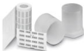
Rys. przedst. wersję produktu EML (15X9)R SR

Etykiety, Rolka, srebrny/mat, nieopisane, opisywany przy pomocy: THERMOMARK ROLL, THERMOMARK ROLL X1, THERMOMARK X1.2, THERMOMARK S1.1, Rodzaj montażu: Klejenie, Wielkość pola opisowego: 26,5 × 17,5 mm