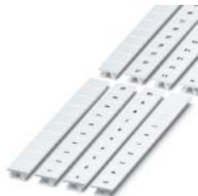
Taśma oznaczników, 10-częściowa, nadruk podłużny z kolejnymi liczbami: 11 ... 20, biały, Szerokość: 10 mm

Należy pamiętać, że podane dane pochodzą z katalogu online. Proszę o pobranie kompletnych informacji i danych z dokumentacji użytkownika. Obowiązują ogólne warunki użytkowania dla materiałów pobieranych przez Internet. ( http://phoenixcontact.pl/download )