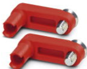
Zapasowa prowadnica kabla 1,0 mm 2 , do tulei CF 3000 HZG 1,0

Należy pamiętać, że podane dane pochodzą z katalogu online. Proszę o pobranie kompletnych informacji i danych z dokumentacji użytkownika. Obowiązują ogólne warunki użytkowania dla materiałów pobieranych przez Internet. ( http://phoenixcontact.pl/download )