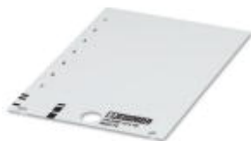
Rysunek przedstawia wariant produktu

Szyldzik zapadkowy, Karta, biały, nieopisane, opisywany przy pomocy: THERMOMARK PRIME, THERMOMARK CARD, Rodzaj montażu: zatrzaskiwać na uchwyty tabliczek, Wielkość pola opisowego: 20 × 9 mm