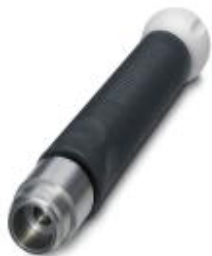
Narzędzie do odblokowania obudowy styków do montażu złączy sygnalizacji zwrotnej M23 urządzeń

Należy pamiętać, że podane dane pochodzą z katalogu online. Proszę o pobranie kompletnych informacji i danych z dokumentacji użytkownika. Obowiązują ogólne warunki użytkowania dla materiałów pobieranych przez Internet. ( http://phoenixcontact.pl/download )