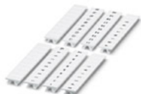
Taśma oznaczników, 10-częściowa, nadruk poprzeczny z kolejnymi liczbami: 1 ... 10, biały, Szerokość: 5 mm

Należy pamiętać, że podane dane pochodzą z katalogu online. Proszę o pobranie kompletnych informacji i danych z dokumentacji użytkownika. Obowiązują ogólne warunki użytkowania dla materiałów pobieranych przez Internet. ( http://phoenixcontact.pl/download )