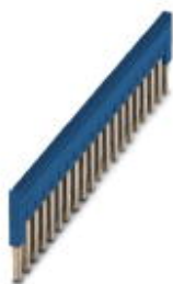
Mostek wtykany, Wymiar rastra: 4,2 mm, Liczba biegunów: 20, Kolor: niebieski

Należy pamiętać, że podane dane pochodzą z katalogu online. Proszę o pobranie kompletnych informacji i danych z dokumentacji użytkownika. Obowiązują ogólne warunki użytkowania dla materiałów pobieranych przez Internet. ( http://phoenixcontact.pl/download )