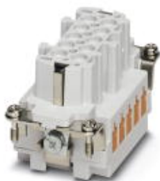
Wkładka styków żeńskich HEAVYCON serii B10, 10-polowa, złącze QUICKON

Należy pamiętać, że podane dane pochodzą z katalogu online. Proszę o pobranie kompletnych informacji i danych z dokumentacji użytkownika. Obowiązują ogólne warunki użytkowania dla materiałów pobieranych przez Internet. ( http://phoenixcontact.pl/download )