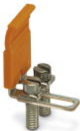
Mostek łączeniowy, Wymiar rastra: 8,2 mm, Liczba biegunów: 2, Kolor: srebrny

Należy pamiętać, że podane dane pochodzą z katalogu online. Proszę o pobranie kompletnych informacji i danych z dokumentacji użytkownika. Obowiązują ogólne warunki użytkowania dla materiałów pobieranych przez Internet. ( http://phoenixcontact.pl/download )