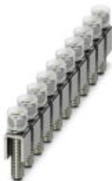
Mostek stały, Liczba biegunów: 10, Kolor: srebrny

Należy pamiętać, że podane dane pochodzą z katalogu online. Proszę o pobranie kompletnych informacji i danych z dokumentacji użytkownika. Obowiązują ogólne warunki użytkowania dla materiałów pobieranych przez Internet. ( http://phoenixcontact.pl/download )