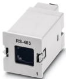
Złącze transmisji danych lub konfiguracji oprogramowania RS-485

Należy pamiętać, że podane dane pochodzą z katalogu online. Proszę o pobranie kompletnych informacji i danych z dokumentacji użytkownika. Obowiązują ogólne warunki użytkowania dla materiałów pobieranych przez Internet. ( http://phoenixcontact.pl/download )