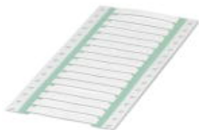
Rys. przedstawia wersję WMS 6,4 (30X10)R

Należy pamiętać, że podane dane pochodzą z katalogu online. Proszę o pobranie kompletnych informacji i danych z dokumentacji użytkownika. Obowiązują ogólne warunki użytkowania dla materiałów pobieranych przez Internet. ( http://phoenixcontact.pl/download )