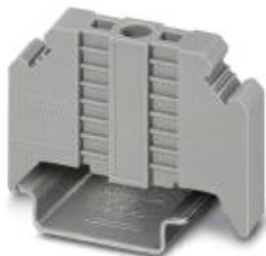
Trzymacz końcowy, Szerokość: 9,5 mm, Wysokość: 32,8 mm, Długość: 48,6 mm, Kolor: niebieski

Należy pamiętać, że podane dane pochodzą z katalogu online. Proszę o pobranie kompletnych informacji i danych z dokumentacji użytkownika. Obowiązują ogólne warunki użytkowania dla materiałów pobieranych przez Internet. ( http://phoenixcontact.pl/download )