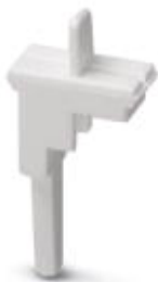
Blokada przełączania, Długość: 12 mm, Szerokość: 8,2 mm, Kolor: biały

Należy pamiętać, że podane dane pochodzą z katalogu online. Proszę o pobranie kompletnych informacji i danych z dokumentacji użytkownika. Obowiązują ogólne warunki użytkowania dla materiałów pobieranych przez Internet. ( http://phoenixcontact.pl/download )