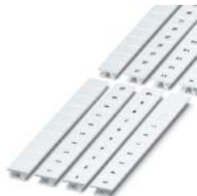
Taśma oznaczników, 10-częściowa, nadruk podłużny z kolejnymi liczbami: 31 ... 40, biały

Należy pamiętać, że podane dane pochodzą z katalogu online. Proszę o pobranie kompletnych informacji i danych z dokumentacji użytkownika. Obowiązują ogólne warunki użytkowania dla materiałów pobieranych przez Internet. ( http://phoenixcontact.pl/download )