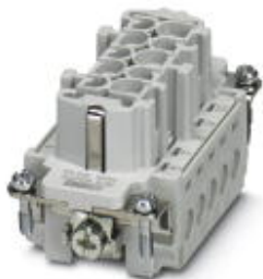
Wkładka żeńska HEAVYCON seria B10, 10-polowa, złącze śrubowe

Należy pamiętać, że podane dane pochodzą z katalogu online. Proszę o pobranie kompletnych informacji i danych z dokumentacji użytkownika. Obowiązują ogólne warunki użytkowania dla materiałów pobieranych przez Internet. ( http://phoenixcontact.pl/download )