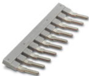
Mostek wtykany, Wymiar rastra: 10 mm, Liczba biegunów: 10, Kolor: szary

Należy pamiętać, że podane dane pochodzą z katalogu online. Proszę o pobranie kompletnych informacji i danych z dokumentacji użytkownika. Obowiązują ogólne warunki użytkowania dla materiałów pobieranych przez Internet. ( http://phoenixcontact.pl/download )