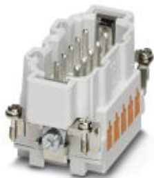
Wkładka męska HEAVYCON seria B10, 10-polowa, złącze QUICKON

Należy pamiętać, że podane dane pochodzą z katalogu online. Proszę o pobranie kompletnych informacji i danych z dokumentacji użytkownika. Obowiązują ogólne warunki użytkowania dla materiałów pobieranych przez Internet. ( http://phoenixcontact.pl/download )