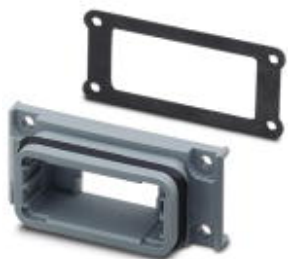
rama nabudowana D-SUB, rozmiar Shell 1, stopień ochrony IP67

Należy pamiętać, że podane dane pochodzą z katalogu online. Proszę o pobranie kompletnych informacji i danych z dokumentacji użytkownika. Obowiązują ogólne warunki użytkowania dla materiałów pobieranych przez Internet. ( http://phoenixcontact.pl/download )