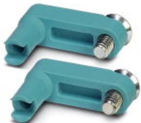
wymienna prowadnica kabla, do CF 3000-TOOLKIT 0,25

Należy pamiętać, że podane dane pochodzą z katalogu online. Proszę o pobranie kompletnych informacji i danych z dokumentacji użytkownika. Obowiązują ogólne warunki użytkowania dla materiałów pobieranych przez Internet. ( http://phoenixcontact.pl/download )