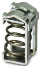
Złącze ekranu, do połączenia ekranu z szyną zbiorczą

Należy pamiętać, że podane dane pochodzą z katalogu online. Proszę o pobranie kompletnych informacji i danych z dokumentacji użytkownika. Obowiązują ogólne warunki użytkowania dla materiałów pobieranych przez Internet. ( http://phoenixcontact.pl/download )