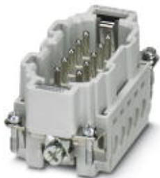
Wkładka styków męskich HEAVYCON, seria B10, 10-pinowa, zacisk śrubowy

Należy pamiętać, że podane dane pochodzą z katalogu online. Proszę o pobranie kompletnych informacji i danych z dokumentacji użytkownika. Obowiązują ogólne warunki użytkowania dla materiałów pobieranych przez Internet. ( http://phoenixcontact.pl/download )