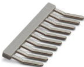
Mostek wtykany, Wymiar rastra: 5 mm, Liczba biegunów: 10, Kolor: szary

Należy pamiętać, że podane dane pochodzą z katalogu online. Proszę o pobranie kompletnych informacji i danych z dokumentacji użytkownika. Obowiązują ogólne warunki użytkowania dla materiałów pobieranych przez Internet. ( http://phoenixcontact.pl/download )