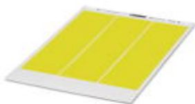
Rys. przedst. wersję artykułu

Arkusz etykiet DIN-A4, Arkusz, żółty, nieopisane, opisywany przy pomocy: Systemy drukowania Office, Rodzaj montażu: Klejenie, Wielkość pola opisowego: 18 × 8 mm