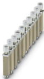
Mostek stały, Wymiar rastra: 8,2 mm, Liczba biegunów: 10, Kolor: srebrny

Należy pamiętać, że podane dane pochodzą z katalogu online. Proszę o pobranie kompletnych informacji i danych z dokumentacji użytkownika. Obowiązują ogólne warunki użytkowania dla materiałów pobieranych przez Internet. ( http://phoenixcontact.pl/download )