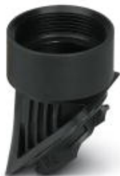
Adapter, tworzywo sztuczne, do obudowy EVO, gwint M40

Należy pamiętać, że podane dane pochodzą z katalogu online. Proszę o pobranie kompletnych informacji i danych z dokumentacji użytkownika. Obowiązują ogólne warunki użytkowania dla materiałów pobieranych przez Internet. ( http://phoenixcontact.pl/download )