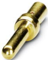
Styk zaciskany, toczone, Średnica styków: 2 mm, Przekrój końcówek: 1,5 mm 2 ...2,5 mm 2

Należy pamiętać, że podane dane pochodzą z katalogu online. Proszę o pobranie kompletnych informacji i danych z dokumentacji użytkownika. Obowiązują ogólne warunki użytkowania dla materiałów pobieranych przez Internet. ( http://phoenixcontact.pl/download )